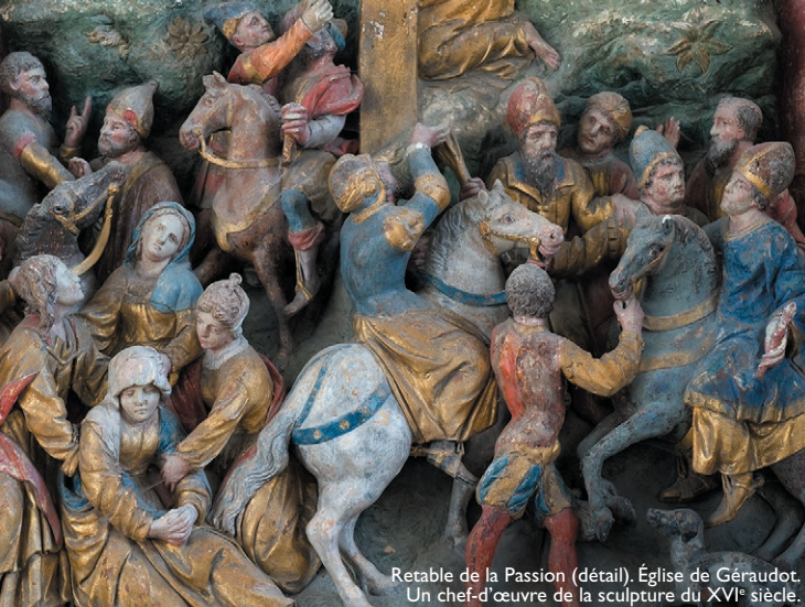
Retable de la Passion (détail), Église de Géraudot. Un chef-d'œuvre de la sculpture du XVI e siècle.